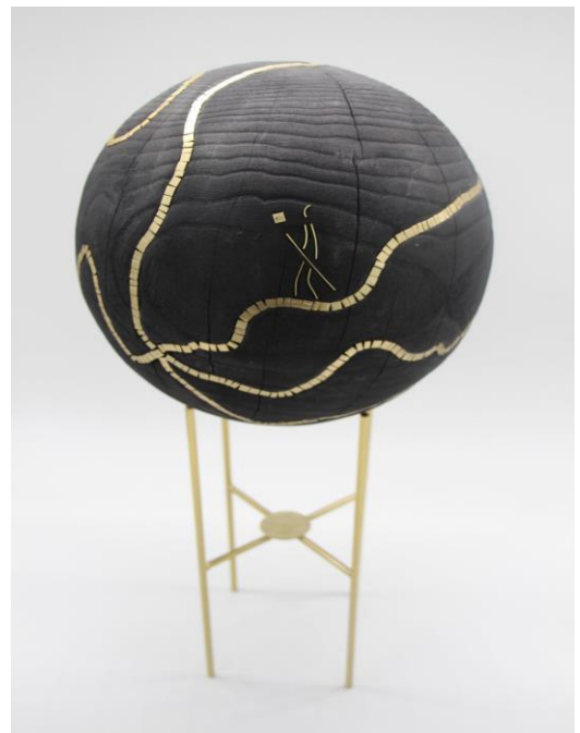
L'œuvre rattaché au prix Jeannine Warcollier