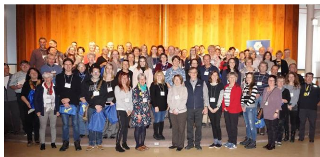
Les membres ayant reçu le Credencial

Le coup d'envoi de la région de Québec s'est déroulé lors d'une superbe journée qui a eu lieu le 9 mars dernier. Au total, 134 participants ont échangé sur le chemin, 86 d'entre eux ont reçu leur Credencial et 92 ont poursuivi les échanges lors d'un délicieux souper. Merci aux organisateurs et aux participants