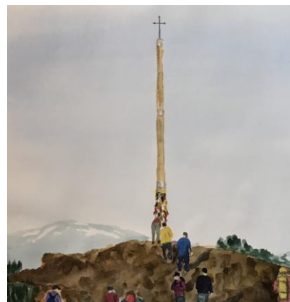
Aquarelle de Louis Vadeboncoeur

Au nom de tous les bénévoles de Laval Laurentides.