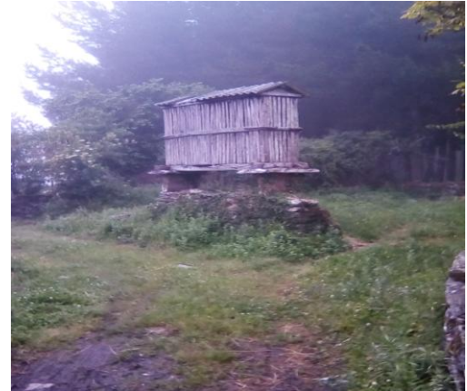
Un hórreo en Galice

Les gîtes sont en nombre suffisants et faciles à trouver dans les villages, mais dans les villes, s'ils sont à l'écart du chemin, c'est une autre histoire. Il m'est arrivé de me rendre au Bureau de tourisme pour en trouver un. Début avril, certains gîtes ne sont pas encore ouverts. Une fois, j'ai dormi à la belle étoile (expérience agréable) et une autre, j'ai marché quelques kilomètres supplémentaires. Vérifier la veille est peut-être une bonne idée.