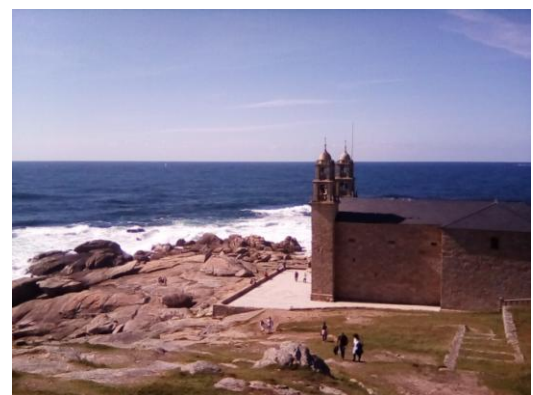
L'église « A Nosa Senora da Barca » (Notre-Dame-de-la-Barque) à Muxia