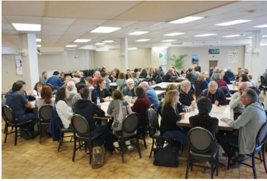
Atelier d'échanges et de réflexion