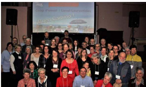
Les récipiendaires 2019. Ulteïa et Buen Camino.

Le 20 mars dernier la soirée du coup d'envoi de Laval-Laurentides battait son plein. Quarante-vingt-dix-neuf personnes étaient présentes alors qu'une soixantaine d'entre elles recevaient leur Credencial .