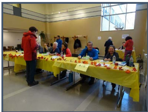
En 2017, une équipe de six bénévoles souriants pour accueillir les participants.

N.B. Un oreiller et une couverture sont fournis par l'établissement, mais pas les draps.