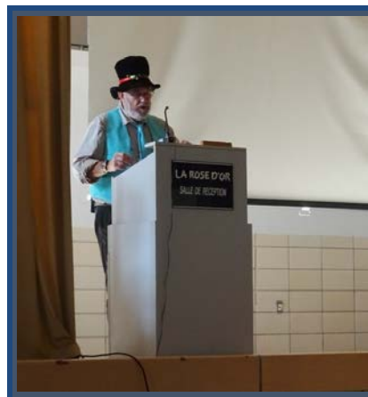
Le mot de bienvenue lors du Grand Rassemblement 2017

Des « produits maison » en lien avec Compostelle seront proposés