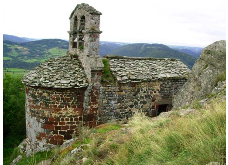
La chapelle St-Jacques de Rochegude qu'on rencontre sur la Via Podiensis entre St-Privat-d'Allier et Saugues

Permettez donc aux gens qui ont sillonné différents chemins de Compostelle de revivre de belles émotions au moyen d'une de vos photos souvenirs.