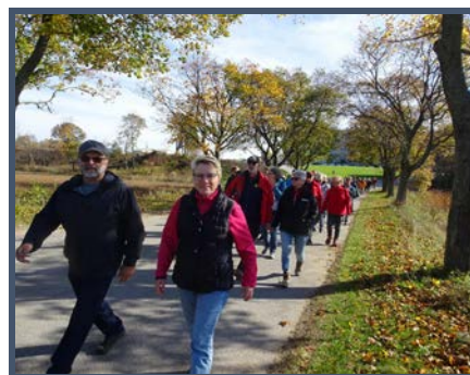
Chaque année, une sortie est organisée. Une marche sous les couleurs d'automne