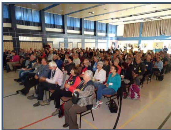
Près de 250 participants dans une atmosphère très festive