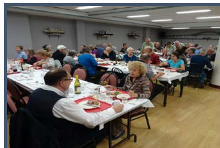
La journée qui se termine autour d'un souper dans l'esprit du Camino