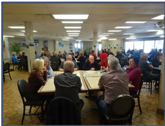
En après-midi, des tables de discussion permettent les échanges entre les participants

« Chaque pas est un dépassement quand un projet naît, qu'il se matérialise et se définit, puis qu'il se réalise. Chacun de nous, quel que soit le nombre de pas, a un destin du marcheur vers des lieux qui ne sont pourtant que le début. Car c'est en revenant, que nous prenons conscience de l'accomplissement et du dépassement ».